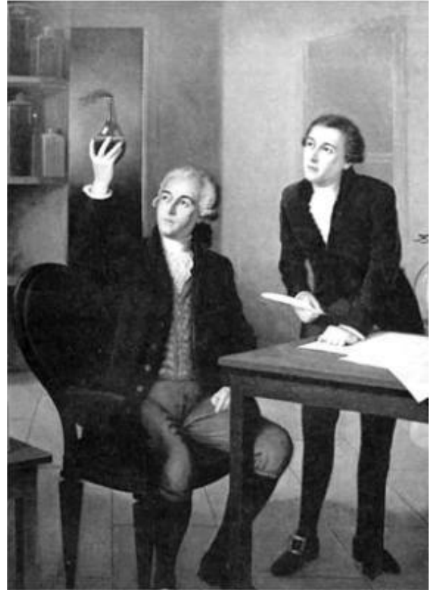
Lavoisier araştırması sırasında

Plüton Kova burcundayken ya karanlık maddenin varlığının gösterilmesi ya da aksinin ispat edilmesi beklenir.