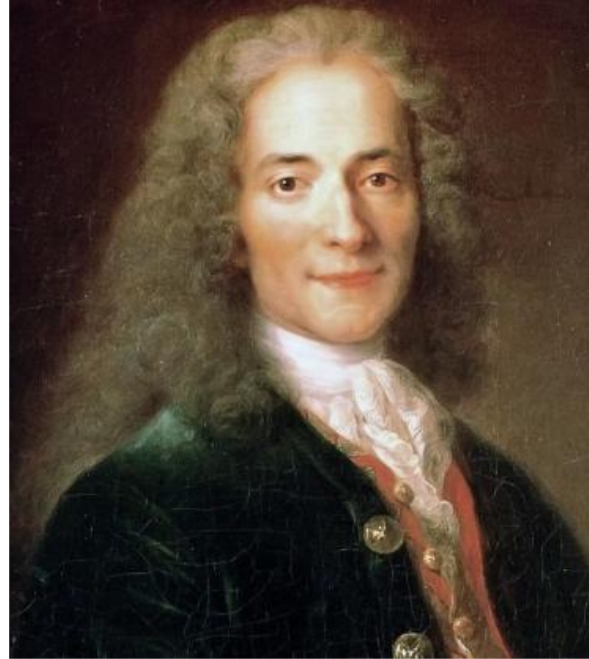
François-Marie Arouet (Voltaire), 1725 civarı

da var: Eski, devri geçmiş yapıları çözmek, Plüton'un işidir. Böylece kimi durumda güçlü bir şirket, kimi durumda da nüfuz sahibi siyasi bir grup, bu geçiş sürecinde ve Plüton'un Kova'da kaldığı sürede ya yıkılacak ya da dönüşüme uğrayacaktır. Bu akla yakın bir durum, çünkü Kova burcu bir yandan gruplarla ve topluluklarla, diğer yandan evrim ve aydınlanma temalarıyla ilişkilidir.